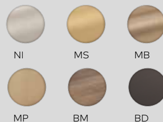
Weitergehende Details und Bestellangaben finden Sie im aktuellen Kaba Katalog.

dormakaba Austria GmbH Ulrich-Bremi-Straße 2 | A-3130 Herzogenburg Tel. 02782 808-0* | Fax 02782 808-5505