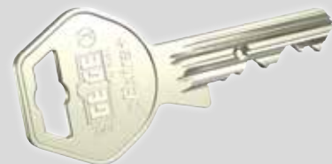
pextra+ Schlüssel mit serienmäßigen seitlichen Verriegelungselementen

Der neue Abfragestift dient als zusätzliches, blockierendes Element im Zylinderkern und blockiert bei manipulierten Schlüsseln den Sperrversuch in beide Richtungen. Bei Zylindertypen, die eine 360° Drehung des Zylinderkerns zulassen würden (z.B. Doppelzylinder), wird dabei das Sperren mit einem manipulierten Schlüssel verhindert. Diese nicht als mechanischer Einbruchschutz anzusehende Sicherheitsmaßnahme bietet somit einen hervorragenden Schlüsselkopierschutz .